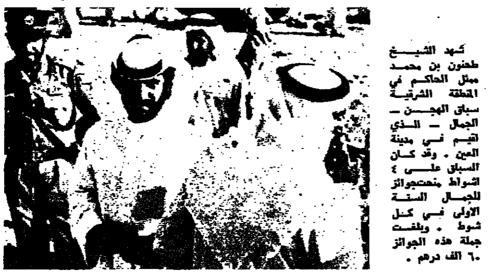
الشيخ طهون بن محمد ممثل الحاكم في المنطقة الشرقية سباق الجمال - الذي اقيم في مدينة العين - وقد كان السباق على السواحل الجنوبية للسواحل الشرقية للبحر الاحمر في اول شهر كانون الثاني .